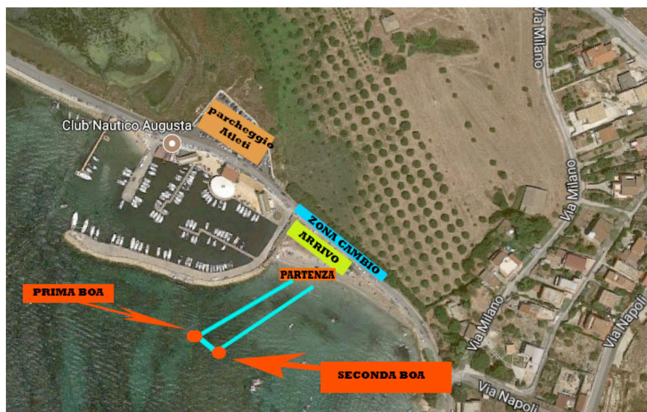
Fig Percorso Bike

Il percorso in bici si svilupperà su un circuito di 7 km da ripetere 3 volte , è molto importante rispettare sempre il codice della strada tenendo la destra , il tracciato uscendo dalla zona cambio vi porterà in direzione Augusta attraversando da prima il lungomare Granatello poi parte del lungomare Rossini per andare a prendere la bretella di raccordo con corso Sicilia ,poco prima della rotatoria ad Angolo con Via Matteotti troverete un primo giro di boa , girata la boa ci sarà un piccolo strappetto in salita che vi condurrà sul ponte Federico II in direzione Augusta ( MOLTO IMPORTANTE: sul ponte chiunque oltrepassi la doppia linea continua sarà squalificato) alla fine del ponte troverete una seconda boa da prendere in senso ORARIO quindi da sinistra girata questa vi ritroverete nella direzione opposta di ritorno ripercorrendo il ponte nuovamente fino a prima della rotatoria ma questa volta sulla corsia opposta troverete un terzo giro di boa girato questo nuovamente in direzione augusta andrete a prendere la bretella sulla destra che vi riporterà sul lungomare Rossini e a seguire Granatello per poi arrivare nuovamente in zona cambio dove troverete il giro di boa così avrete concluso il giro. Il circuito è completamente chiuso al traffico.[Esclusi i mezzi dell'organizzazione e di Pronto Intervento].